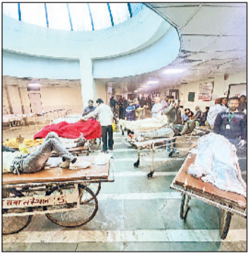
रोहतक। हादसे में घायल मरीज। (फाइल फोटो)