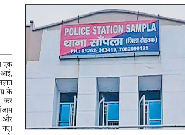
सांपला। पुलिस थाना की फाइल फोटो।