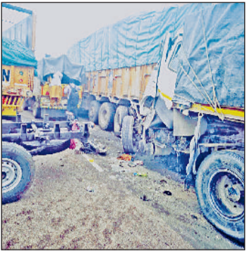
रोहतक। 152 डी पर भिड़े वाहन। (फाइल फोटो)