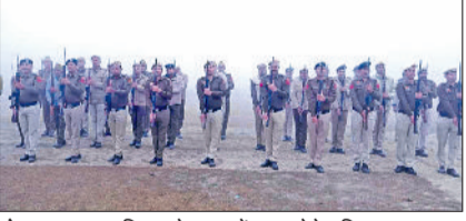
रोहतक। साप्ताहिक परेड का में भाग लेते पुलिस अधिकारी व जवान।