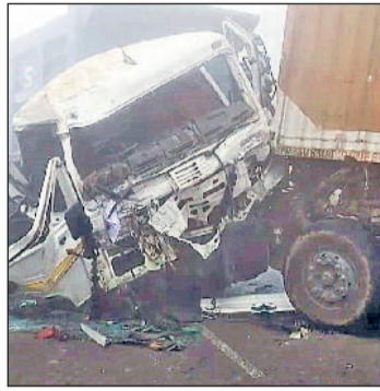
रोहतक। आपस में भिड़े वाहन। (फाइल फोटो)

यह साल रोहतक की सड़कों पर कई गहरे ‘जख्म’ छोड़ गया। एक्सप्रेस-वे पर रफ्तार के कारण न जाने कितने घरों के चिराग बुझ गए और कई जिंदगियों ने सड़कों पर ही सिसक-सिसक कर दम तोड़ दिया। कहीं, पिता की लाश सड़क पर पड़ी मिली, तो कहीं मां की गोद सूनी हो गई। पेश है सड़क हादसों पर इस साल की रिपोर्ट...।