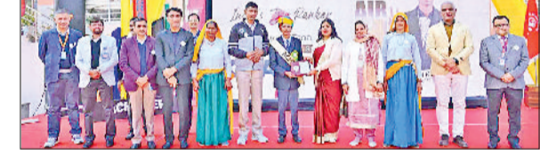
महेंद्रगढ़। बच्चों को सम्मानित करते हुए।